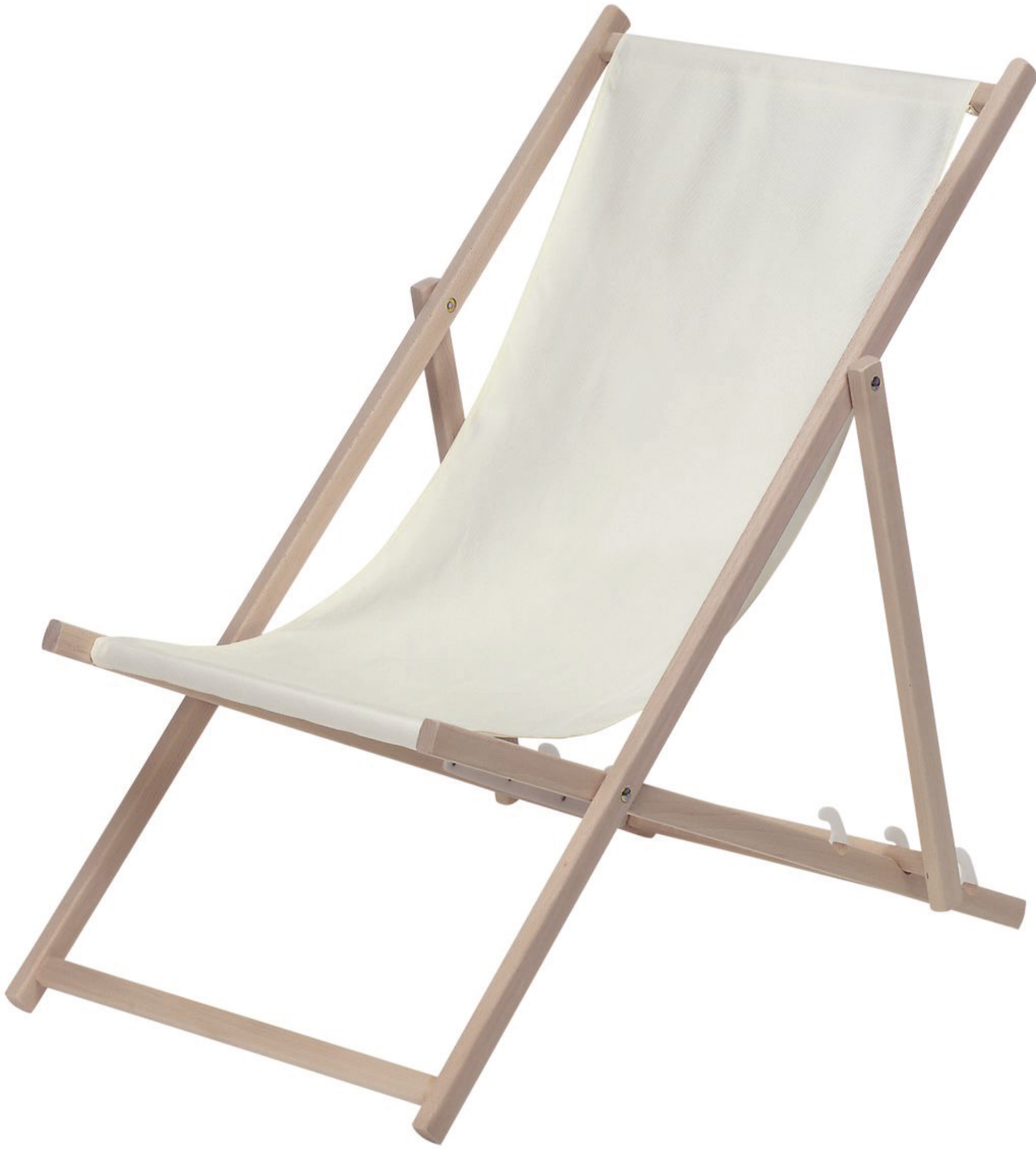
Nur zur Darstellung, ann. proportional Verkleinert